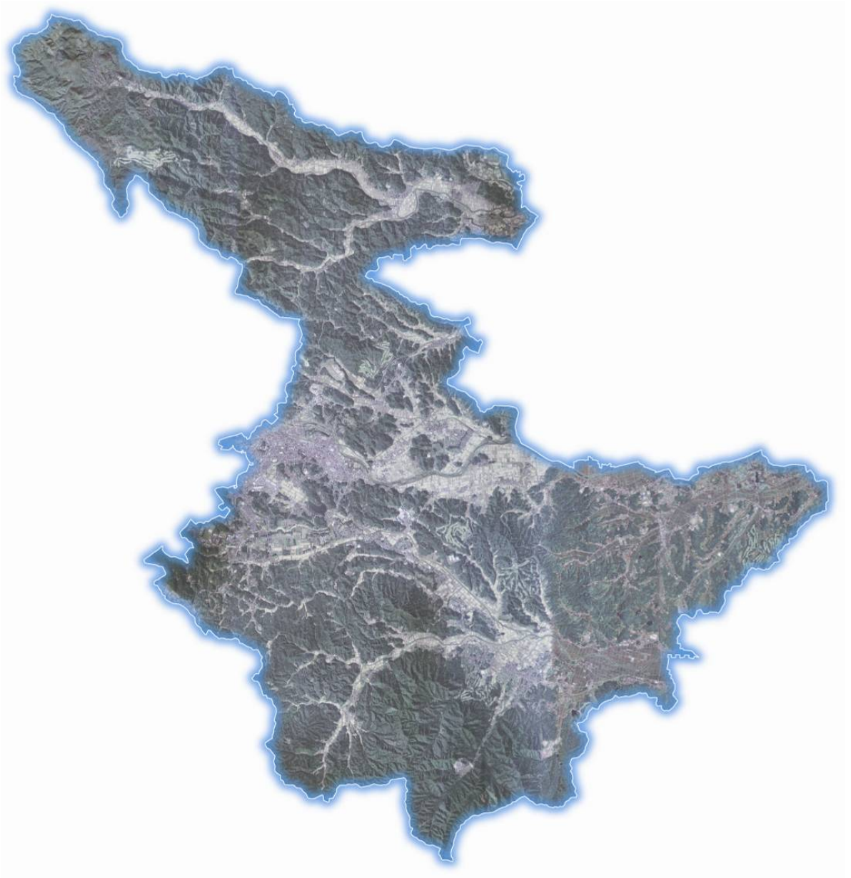
交流創造都市ふるさと白河