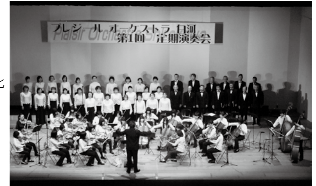
▲平成22年度採択事業 「プレジールオーケストラ白河 第1回定期演奏会」