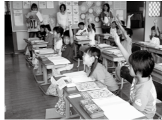
▲わかる授業の推進（1年国語）