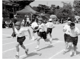
▲全校児童による全校リレー（運動会）