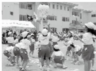
▲春「白三小大運動会」

本校は、来年度に創立100周年を迎え、児童みんなでお祝いする式典などの行事も計画しています。これからも、保護者の皆さまや地域の方々に支えていただきながら、明るく元気な学校を目指します。