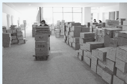
▲図書館引越作業の様子

新館の見学会を事前登録期間に1日数回行う予定です。時間等につきましては、広報白河3月15日号で詳しくお知らせします。