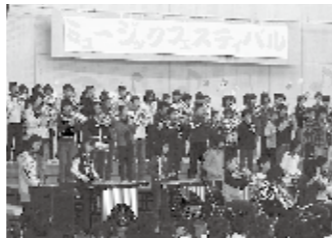
▲秋「ミュージックフェスティバル」