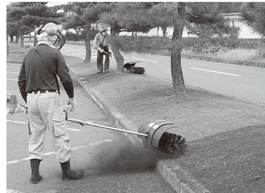
▲芝生の深刈り込み作業の様子。芝を深く刈り取り、エンジン付きブラシでサッチ層(枯れた芝草がたい積したもの)を除去します。刈り取った芝生は、ほうきや熊手で集め搬出します。