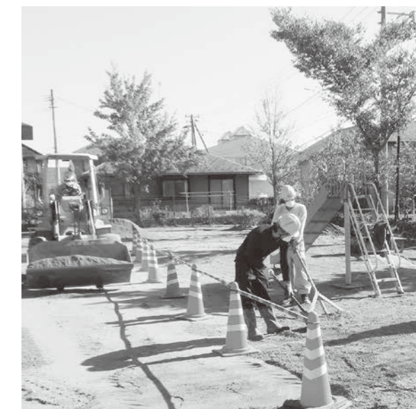
▲公園の表土除去作業の様子。表土を除去した後、山砂を入れ表面を整えます。