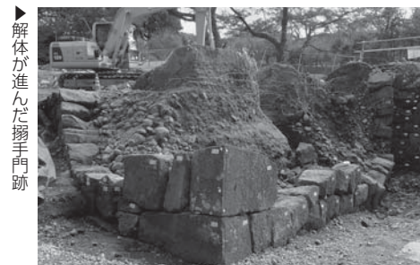
石垣解体作業の様子