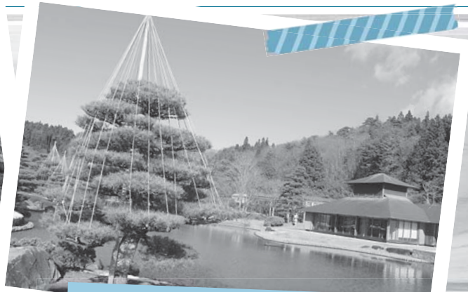
降雪に備えて 雪吊り作業 12月5日・6日/翠楽苑(南湖公園内)