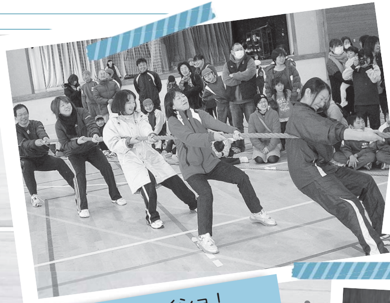
力を合わせてヨイショ! 大信地区市民綱引き大会 12月1日/大信総合運動公園(大信上新城)