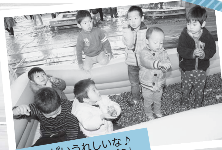
どんぐりいっぱいうれしいな♪ たんぼぼサロン「しぜんとあそぼう」 11月24日/中央体育館(北中川原)