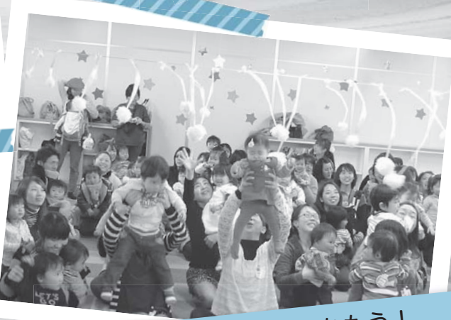
ふわふわ雪玉をつかもう! おひさまひろば「クリスマス会」 12月6日/マイタウン白河(本町)