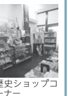
歴史ショップコーナー