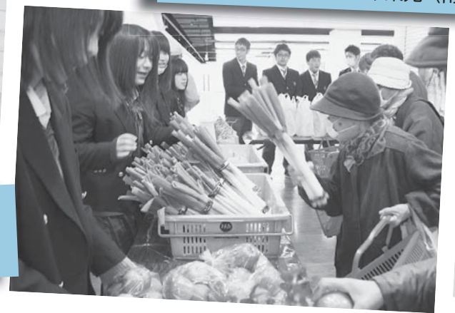
白河実業高生が育てた野菜を販売 本町チャレンジショップ 11月26日/マイタウン白河