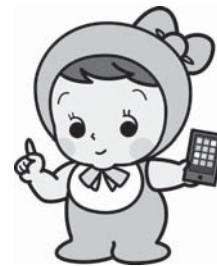
▲愛称：みらいちゃん