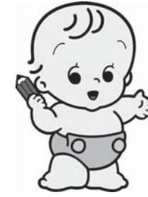
▲愛称：センサスくん