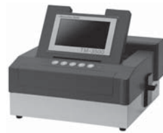
▲米・食味分析鑑定コンクール 国際大会採用メーカー機種

☎本庁舎農政課 ☎21111 内2223 人・農地相談センター 内2298 / 各庁舎事業課 表郷 ☎4785 大信 ☎463973 東 ☎42115