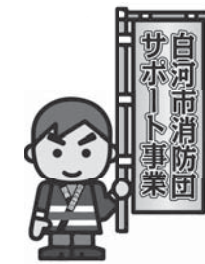
▲全国消防イメージキャラクター「消防」くん