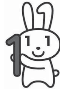
▲愛称：マイナちゃん