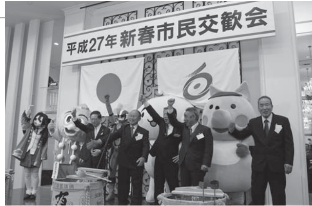
▲「がんばろう」を三唱する参加者