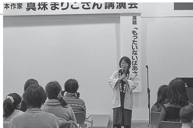
▲真珠さんの話に聞き入る参加者

真珠さんは、自分が著作した絵本の読み語りでも子どもたちを喜ばせたほか、「もったいないばあさんのえかきうた」や「もったいないばあさん音頭」を流し、会場は笑顔であふれていました。