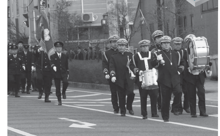
▲小峰通りをパレードする様子