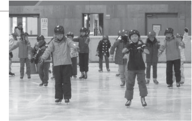
▲楽しく練習する子どもたち

この活動は年に4回、4地域の公民館が合同で開催していて、子どもたちの交流を深めるきっかけになっています。