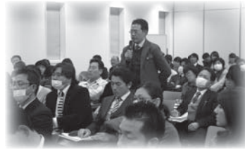
▲「PTAの集い」講演会(平成25年度)