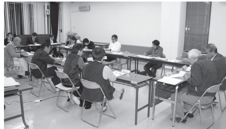
▲「小学校統合推進委員会」会議の様子

これを受け、昨年9月に保育園・幼稚園・小学校のPTA、町内会連合会、大信地域協議会の各代表者と有識者からなる14人で統合に向けた「大信地域小学校統合推進委員会」を組織し、現在、新しい学校が児童にとってより良い環境になるよう、会議や現地視察を行いながら、諸問題の解決に向け協議・検討を行っています。