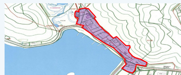
▲導入区域となる湖畔北側

そのため、「歴史的風致維持向上地区計画」を導入し、建物外観等のデザインなど形態意匠をきめ細かくルール化し、民間活力を活かした賑わいの創出に努めていきます。