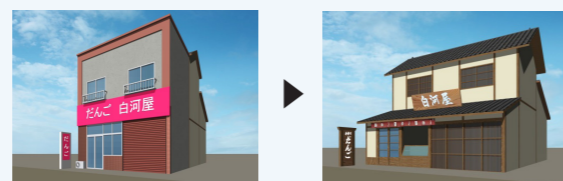
《地区計画導入前》 《地区計画導入後》