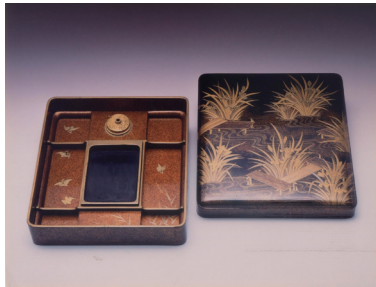
やっほしまあ ちすひはこ 八橋時絵硯箱 (白河集古苑蔵)