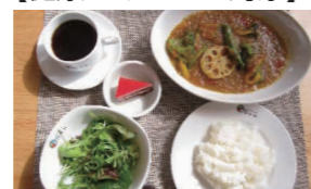
▲デザートは日替わりです