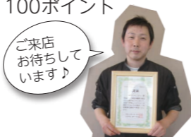
▲認定証を持つ店主