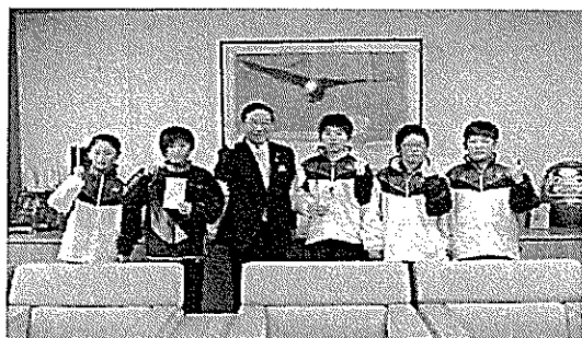
3/23 第17回全国小学生リフトニス 大会出場激励金交付式