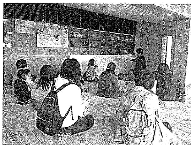
4/5 ちびっこおはなしのくに