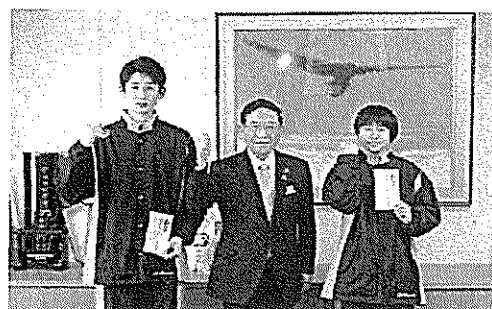
3/23 第31回都道府県対抗ジュニア バスケットボール大会2018出場 激励金交付式