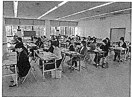
4/2 新採用期限付教職員辞令確認事務