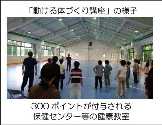
「動ける体づくり講座」の様子