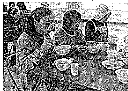
1. 12/21 楽しく体験生き生き講座