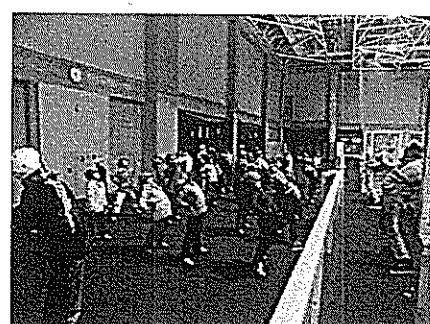
3.12/25 子どもステップ教室 高校生ボランティアセミナー