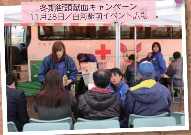
冬期街頭献血キャンペーン 11月28日/白河駅前イベント広場