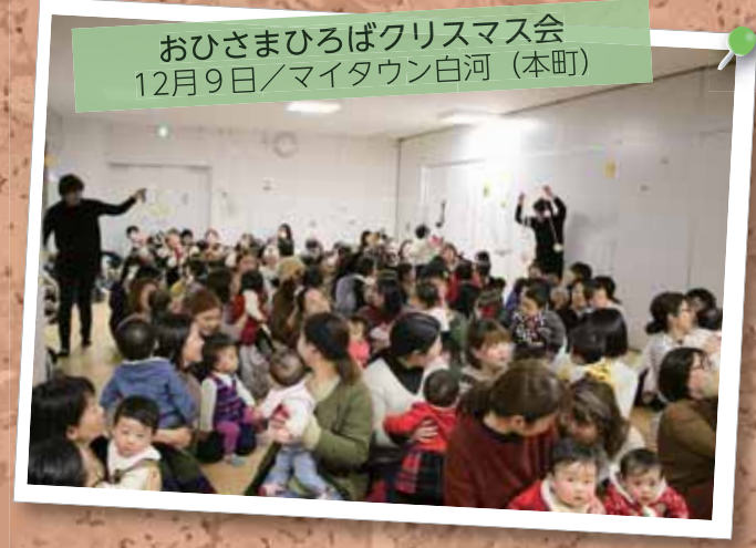
おひさまひろばクリスマス会 12月9日/マイタウン白河(本町)