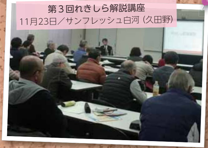
第3回れきしら解説講座 11月23日/サンフレッシュ白河(久田野)