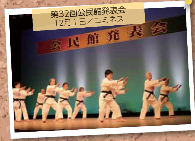
第32回公民館発表会 12月1日/コミネス