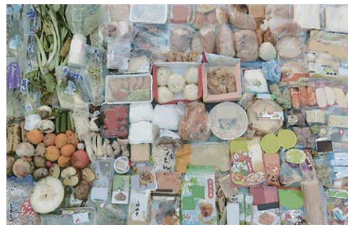
捨てられた手付かずの食品例

食べられるのに捨てられている食品ロスのこと。 日本では、年間600万トン以上の食品ロスが発生しています。 食品ロスの中には、手付かずの状態ですべて捨てられている食品もあり、この状況を多くの方に知っていただくことが大切です。