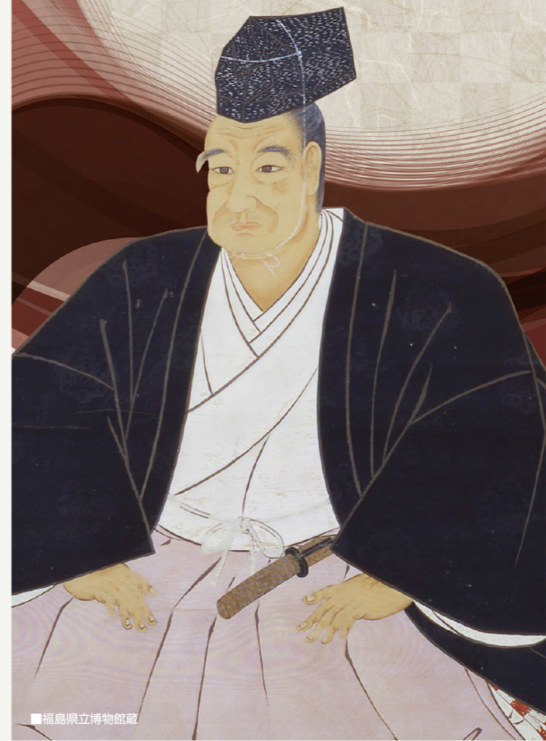
福島県立博物館蔵