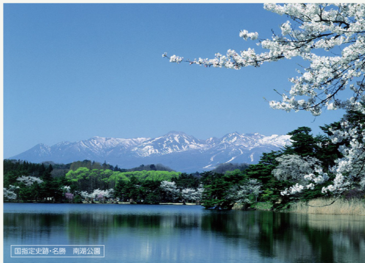
国指定史跡・名勝 南湖公園