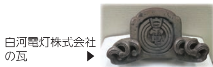
白河電灯株式会社 の瓦