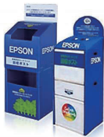
エプソン：インクカートリッジ回収ポスト

各メーカーにおいて製品販売店の店頭「回収ポスト」「回収スタンド」を設置しています。