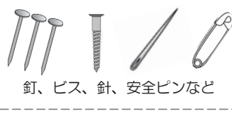
釘、ビス、針、安全ピンなど