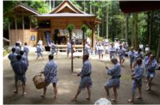
関辺のさんじもさ踊

関辺のさんじもさ踊（県指定）は、関辺地区に伝わるもので、天道（太陽）に正常な運行と害虫の防除を念じて、五穀の豊作を祈る神事である。はやしことばから、さんじもさ踊りと呼ばれ、「むけの朔日」（旧暦6月1日）の行事だったが、現在はその前後の日曜日に関辺の鎮守八幡神社で氏子の青年たちによって行われている。