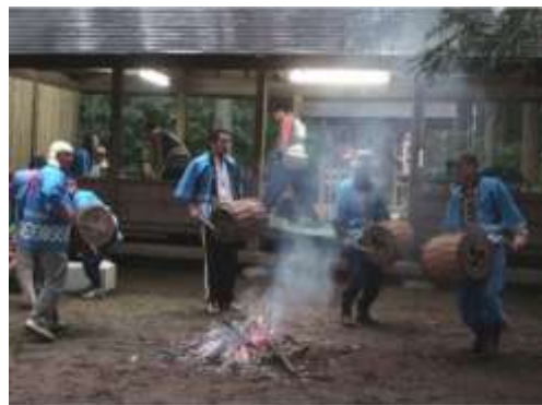
河東田牛頭天王祭

河東田牛頭天王祭（市指定）は、表郷河東田地区に伝わる祭礼である。牛頭天王は、インドの祇園精舎の守護神で、除疫神として祀られた。由来より考えると旧暦6月の祭事であり一種の夏越萩であり、胡瓜天王の謂から農神としても崇められた祭神である。祭礼は現在も継承され、毎年6月14日・15日に実施されている。現在は、地区にある4基の太鼓を打ち鳴らし祭礼を盛り上げている。胡瓜を祭壇に供え五穀豊穡を祈る風習のあるところから、別に「胡瓜天王様」ともいわれている。