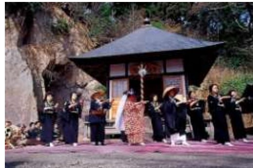
奥州白河歌念仏踊

奥州白河歌念仏踊（県指定）は、白河付近の村々に伝承されている。根田組、久田野組、釜の子組、柏野組、羽太組等それぞれの集落にある念仏踊りは、村内安全と五穀豊穡を祈ることに始まったといわれるが、長い間に舞踊化し、交情和親の娯楽ともなっており、各村に定着した。なお、根田地区においては「道成寺物語」の安珍僧が、市内萱根の生まれと伝えられ、これにちなんだ歌詞や踊りがあるので「安珍念仏踊」として有名である。旧暦2月27日（現在は3月27日）の安珍忌には歌と踊りで供養する。