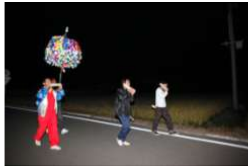
中ノ沢権現梵天祭

中ノ沢権現梵天祭（市指定）は、表郷梁森地区に伝わるもので、大山祇神を祀る中ノ沢権現で、五穀豊穡を祈願し行われるようになったといわれている。奉幣は、隔年旧暦8月8日に行われている。