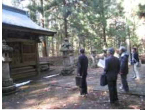
文化財保護審議会現地視察

白河市では、文化財の保存・活用に関する業務は、教育委員会事務局文化財課（文化財保護係・文化財調査係）の9人で担当している。事務所を歴史民俗資料館内に置き、收藏資料内の文化財の保存・活用について、より密接に関わることができる体制となっている。また、白河集古苑にも文化財課職員1人を配属しているため、集古苑所蔵の文化財の保存・管理について、速やかに対応できる体制となっている。