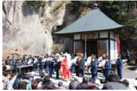
地域の民俗芸能を披露する中学生

介しているほか、すべての指定文化財への誘導・説明板の設置を進めている。また、埋蔵文化財発掘調査の現地説明会を開催しているほか、出前講座事業や各団体の学習会等に積極的に講師派遣を行うなど、文化財への理解・知識の高揚に努めている。さらに、文化財保護強調週間及び文化財防火デーに併せた文化財の公開等も実施している。