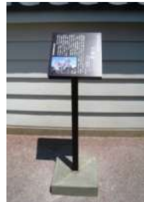
指定文化財説明板

しかし、その一方では収蔵資料の増加に伴い、資料館収蔵庫のスペース不足が大きな課題となっている。また、埋蔵文化財出土品の収蔵施設が各所に点在しているため、一括管理・保存を図ることが困難な状況となっている。今後は、財政状況を勘案し、施設改修計画や新たな収蔵施設の確保に努めていく。