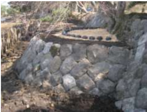
史跡及び名勝南湖公園の護岸整備

今後も、文化財の状況を常に把握した上で、法令に基づき適切な保存を図るとともに、計画的な修理・整備を行う。また、専門的な指導・助言を得ながら、文化財が持つ歴史的価値の保持に努めていく。