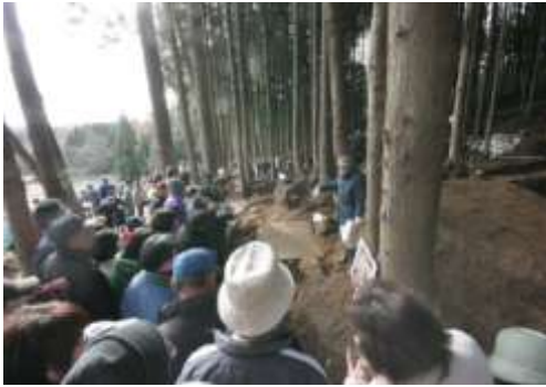
埋蔵文化財現地説明会の様子

市内の文化財を広く市民へ公開し、文化財保護精神の普及・啓発を図るため、白河市ではホームページで国・県・市指定の文化財を写真及び説明付きで分かりやすく紹