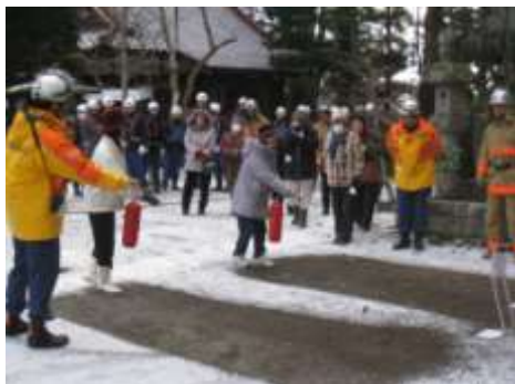
消火器による火災防御訓練

防災訓練については、文化財防火デーに併せ、火災防御訓練を実施している。実施にあたっては、各地域の建造物を中心とした指定文化財を対象に、市関係各課のほか、所有者・消防署・地元消防団・地元町内会等と連携を図りながら実施しており、地元住民が地域に残る貴重な文化財を自分たちで守っていく意識付けを行うとともに、消火器を使った火災防御訓練を実際に体験することで、火災防御のレベルアップを図っている。