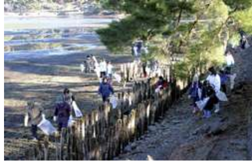
南湖清掃ボランティア

白河市には、白河観光物産協会で所管している観光ボランティアガイド「ツーリズムガイド白河」があり、史跡や名勝である小峰城跡・南湖公園・白河関跡を中心に活動し、来訪者に“白河の魅力”を伝えている。