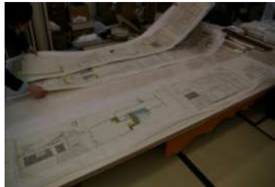
白河城御櫓絵図(県指定)の修復