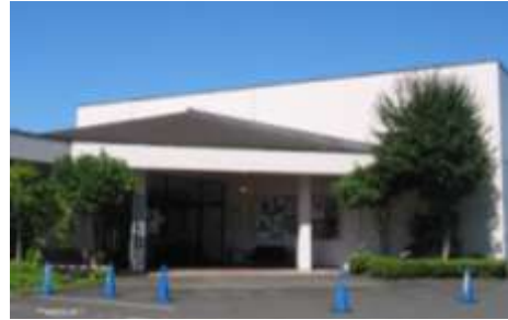
白河市歴史民俗資料館

白河市歴史民俗資料館では、常設展示のほか、収蔵している指定文化財・考古資料・民俗資料・絵画などを中心としたテーマ展及び収蔵品展等