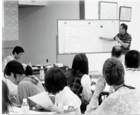
▲第3回市民会議の様子

白河市自治基本条例を考える市民会議活動中/自治基本条例Q&A/自治基本条例キーワード紹介