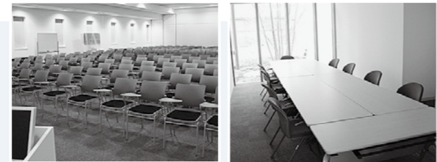
▲大ホールとして展開した中会議室 ▲小会議室

A2 図書館の開館時間や貸出期間などは次のとおりです。 [開館時間] ◇平日：午前10時～午後8時 ◇土・日・祝祭日：午前9時30分～午後6時 [休館日] ◇毎週月曜日(祝日の場合は翌日) ◇毎月第1水曜日(祝日の場合は翌日) ◇年末年始(12月29日～1月3日) ◇特別整理期間(3月～4月の一定期間) [貸出利用期間] ◇21日以内 [貸出のできる冊数] ◇CDとDVDは合計3点まで。 ◇本と雑誌は期間内に利用できる範囲の冊数。