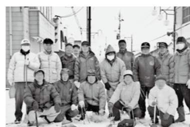
▲本町町内会の皆さん