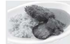
■郡山グリーンカレー（郡山市）