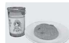
■生酒・白河高原清流豚のメンチカツ（白河市）