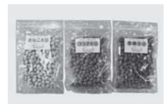
■豆かりんとう（西郷村）