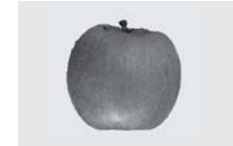
■ふくしまリング（福島市）