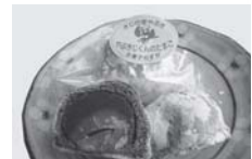
■御旗場名物「やぶさじくんのたまご」(矢吹町)