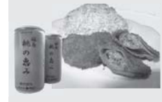
■ウエスタン・モモのジュース（桑折町）