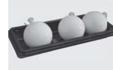
■岳温泉名物玉とうふ3個セット（二本松市）