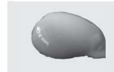
■本宮烏骨鶏のとろり酵母卵2個（本宮市）