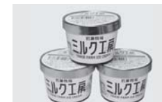
■岩瀬牧場アイスクリーム（鏡石町）