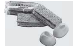
■桃の洋菓子（国見町）