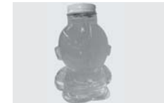
■ウルトラマンジュース（須賀川市）