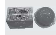
■伊達の恵み（伊達市）