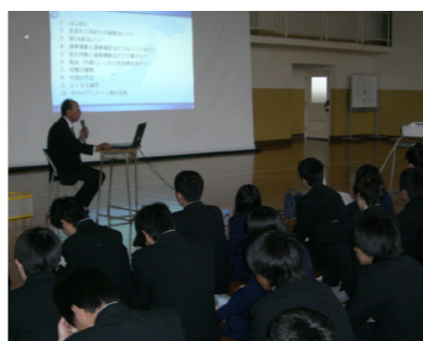
▲選挙講座に真剣に耳を傾ける生徒達

市選挙管理委員会では、近い将来、有権者となる高校生の皆さんを対象に、選挙の仕組みや投票参加の意義について理解を深めてもらい、選挙の大切さを伝えるため、「高校生のための選挙講座」に取り組んでいます。