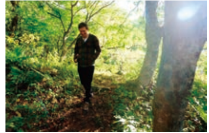
▲五色沼でのハイキング