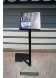
指定文化財説明板