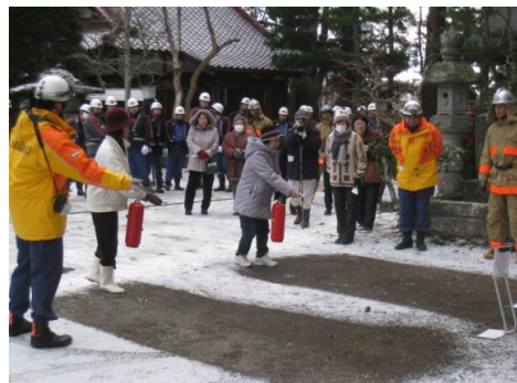
消火器による火災防御訓練