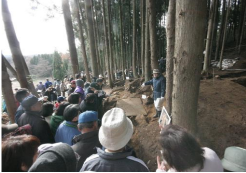
埋蔵文化財現地説明会の様子

市内の文化財を広く市民へ公開し、文化財保護精神の普及・啓発を図るため、白河市ではホームページで国・県・市指定の文化財を写真及び説明付きで分かりやすく紹