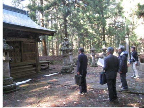
文化財保護審議会現地視察

白河市では、文化財の保存・活用に関する業務は、建設部都市政策室文化財課（文化財保護係・史跡整備係）の11人で担当している。事務所を歴史民俗資料館内に置き、収蔵資料内の文化財の保存・活用について、より密接に関わることができる体制となっている。また、白河集古苑の職員を文化財課職員が一部兼務しているため、集古苑所蔵の文化財の保存・管理について、速やかに対応できる体制となっている。