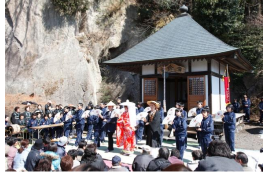
地域の民俗芸能を披露する中学生

介しているほか、すべての指定文化財への誘導・説明板の設置を進めている。また、埋蔵文化財発掘調査の現地説明会を開催しているほか、出前講座事業や各団体の学習会等に積極的に講師派遣を行うなど、文化財に対する知識・理解の高揚に努めている。さらに、文化財保護強調週間及び文化財防火デーに併せた文化財の公開等も実施している。