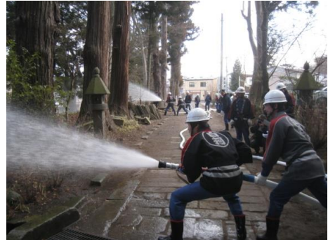
火災防御訓練の様子

今後も、所有者や地域住民、消防機関などの関連機関と連携を図り、更なる防災体制の強化に努めていくとともに、地震や盗難などに対する防災計画についても検討していくよう努める。