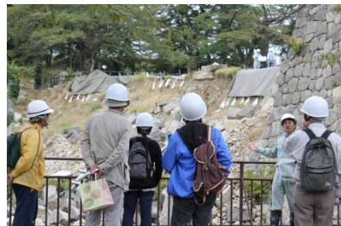
小峰城跡石垣修復箇所一般公開の様子

さらには、東日本大震災により崩落した小峰城跡の石垣修復に対する理解や関心を深めるため、工事の進捗状況や小峰城跡の様子などを定期的に一般公開している。