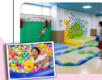
▲ボルダリングやボールプールで遊ぶことができます

料金 無料 休館日 水曜日、年末年始 時間 午前9時～11時50分 午後1時～4時50分 対象者 未就学の子どもと保護者 場所 市総合運動公園内（北中川原30番地） ☎アナビススポーツプラザ ☎@6858