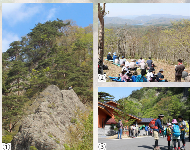
①聖ヶ岩 ②山頂から望む羽鳥湖 ③活動の拠点ビジターセ ンター

本市最高峰。3つの登山コースが整備され、隈戸 川源流のせせらぎやブナ・ミズナラの林、そして山 頂からの眺望と、多様な表情を見せてくれます。聖 ヶ岩ではフリークライミングもできます。