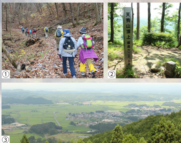
①「日本一遅い山開き」 ②頂上標識と三等三角点 ③展望 所からは表郷地域が一望できます

「日本一遅い」と銘打って、毎年11月23日に山開 きが開催されます。春はカタクリやヤマブキソウ、 夏は新緑、秋は紅葉と四季折々の景色が楽しめます。 片道約1時間、初心者にもおすすめです。