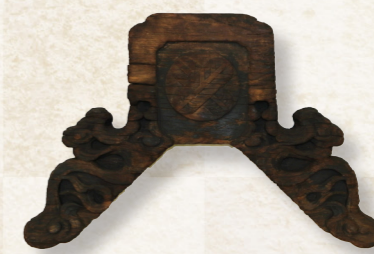
小峰城木製鬼瓦(白河市歴史民俗資料館蔵)