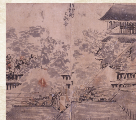
白河口合戦絵巻 (部分、白河市歴史民俗資料館蔵)