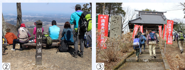
①美しい山容 ②毎年3月の最終日曜日に開催される山開き ③満願寺