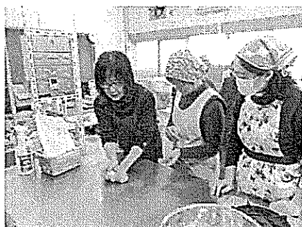
2/14 かんたん Cooking