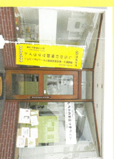
※しらかわチャレンジ応援団(職場見学・体験・実習)についてもお問い合わせください。