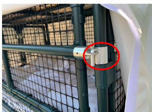
留め具で枠フタを固定する