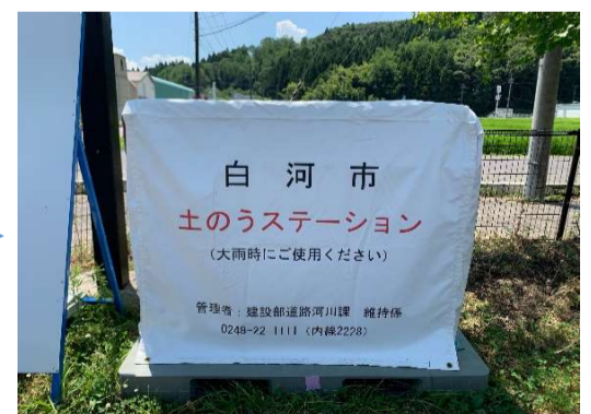
カバーを戻して終わりです。

残りが少なくなりましたら、建設部道路河川課（下記「管理者」）までご連絡ください。