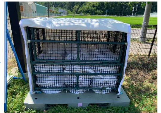
カバーをまくり上げた状態