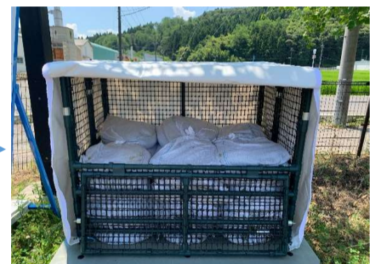
土のうを取り出してください