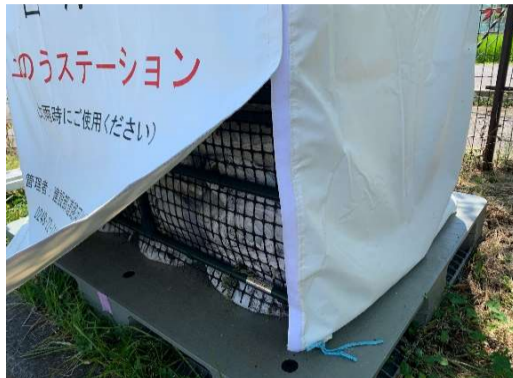
カバーの両端は、マジックテープで固定されています。