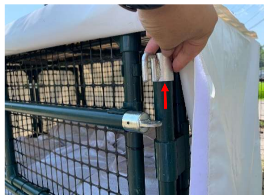
留め具を回して、枠フタが固定されないようにしてください。