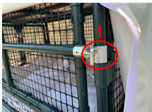
(留め具を上にはずらす)

※前面の枠フタは、留め具を外した時に勢いよく倒れてくる場合がありますので、十分ご注意ください。