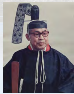
▲「中目瑞男写真」 (南湖神社所蔵)