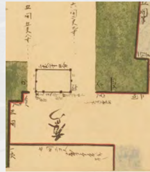
▲藤門跡平面図 『白河城御繪図』より