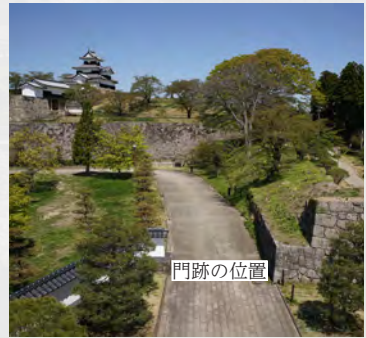
▲藤門跡の位置（南から）

二之丸は、四方が堀に囲まれた東西にやや長い長方形の曲輪でした。各辺の中央には、堀を渡る土橋があり、橋を渡った先に門が設けられていました。二之丸の東側に設けられた藤門では、昭和63年（1988）に城山公園整備に伴い発掘調査が行われ、一辺50cmほどの正方形の礎石（基礎石）が6基確認されました（下図中）。南西部の礎石の一部は確認できませんでしたでしたが、藤門は南北3.2m、東西6mの規模であったと推定されました。 文化年間に作成された『白河城御繪図』には、藤門の平面図（下図左）があり、8基の礎石が描かれています。発掘調査の結果と、絵図の内容がほぼ一致することが確認できました。調査で確認された礎石などは、発見された状態のまま埋戻し、保存を図りました。 発掘調査により遺構が確認されると、門や櫓などの位置が特定されるだけでなく、絵図や文献の記載内容を検証することができます。このような照合作業を積み重ねていくことで、より詳細で正確な小峰城の姿を描けるようになるのです。