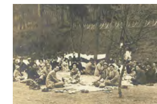
◀南湖公園で宴会を楽しむ人々(1937年)