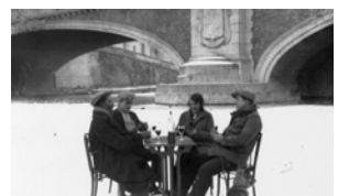
▲珍しく凍結したオワーズ川の上で食前酒を飲む人々(1935年)