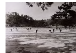
▲「南湖公園スケート遊び」