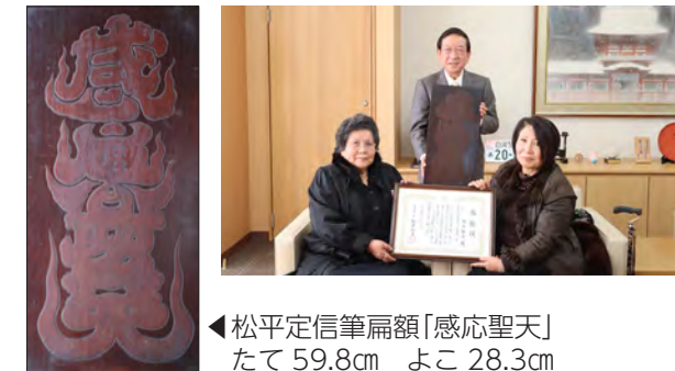
◀松平定信筆扁額「感応聖天」 たて 59.8cm よこ 28.3cm

表面に「感応聖天」(霊験あらたかな聖天(大聖歓喜天)様という意味)、裏面には文化9年(1812)2月の松平定信の署名が彫られています。