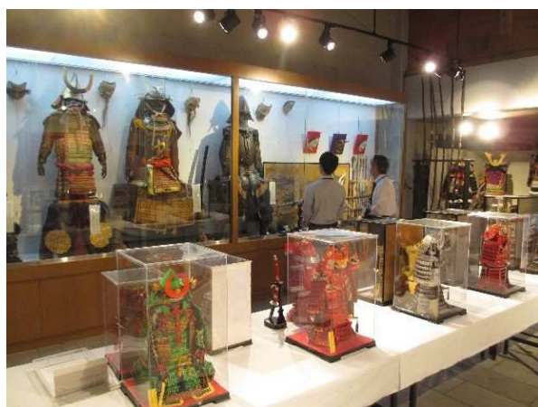
9/27～10/20 テーマ展「中山義秀の愛した武具展」