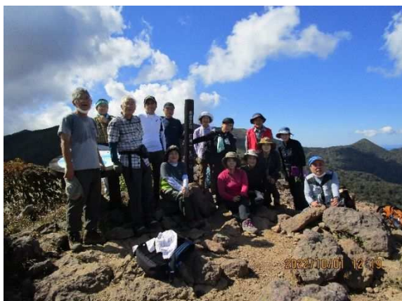
10/1 初心者向けトレッキング教室