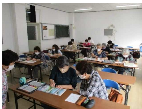
9/29 大人のぬりえ教室