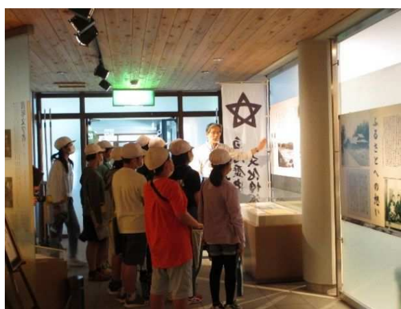
9/29 小田川小学校見学会