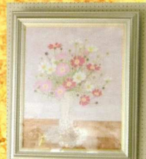
白河日本画「青丹会」