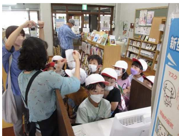
10/4 図書館学習（大信小学校）