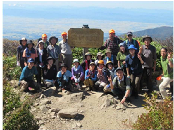
10/1 トレッキング&スパ教室