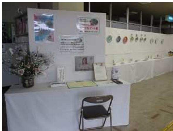
9/8～30 ロビー展「ポーセリンアート展」