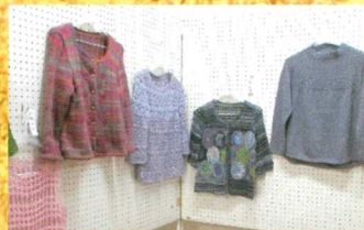
コミュニティ愛好会(編物)