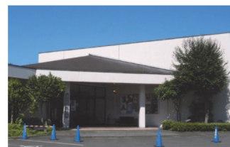
白河市歴史民俗資料館

しかし、その一方で収蔵資料の増加に伴い、資料館収蔵庫のスペース不足が大きな課題となっている。また、発掘調査等で出土した資料の収蔵施設が各所に点在しているため、一括管理・保存を図ることが困難な状況となっている。今後は、財政状況を勘案し、施設改修計画や新たな収蔵施設の確保に努めていく。