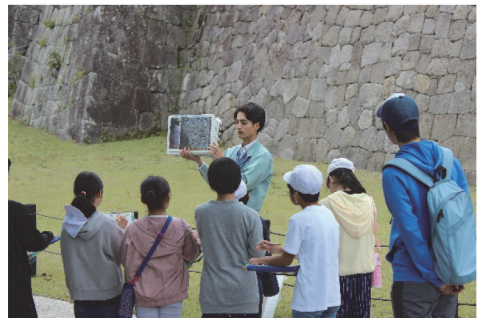
白河の歴史・文化再発見事業の様子