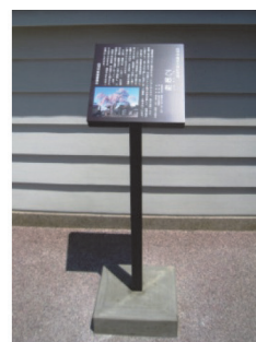
指定文化財説明板