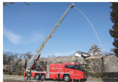
梯上放水訓練の様子

文化財を災害から守り、後世に正しく引き継ぐためには、管理体制の整備が不可欠である。白河市では、「白河市地域防災計画」を定め、文化財管理者への指導として、定期的な防火診断の受診や自主的な点検の実施による火災発生の防止と火災原因の早期発見、消火・警報設備の整備促進などのほか、災害防止のため文化財保存施設の整備として、耐火耐震設備の設置を推進している。現在のところ、消防法で耐火設備の設置を義務付けられている重要文化財（建築物）はないが、火災発生の際、迅速に対応できるよう、義務付けられていない文化財についても自