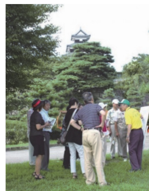
ツーリズムガイド白河による 小峰城の観光案内

この他、文化財の保存・活用に関わっている住民・NPO等各種団体については、文化財ごとに組織された保存・活用団体が主となっている。特に、南湖公園で行われるイベント等については、「南湖を守る会」などの各市民グループや関係機関、NPO法人等が協力・連携して行っている。さらに年1回行われている清掃活動では、多くの市民団体や一般市民が参加し、市民ぐるみの活動を行っている。