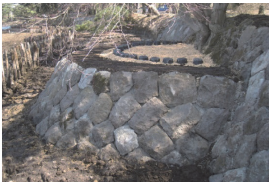
史跡及び名勝南湖公園の護岸整備