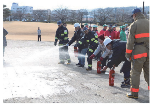
消火器による火災防御訓練