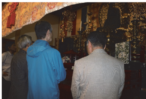
文化財保護審議会現地視察

また、白河市文化財保護条例により、市の諮問機関として文化財保護審議会を設置している。委員は、歴史（中世史）・美術・歴史資料・仏像・建築史・民俗芸能・民俗の専門家7人で構成され、文化財の保存・活用に関する指導・助言を得ている。審議会での検討が困難な分野については、検討委員会や専門委員会を立ち上げる等、適切な審議を行ってきた。今後も、文化財保護行政に対する適切な指導・助言を得ながら文化財の保存・活用を進めていく。