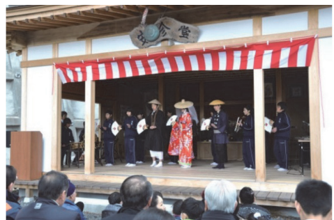
地域の民俗芸能を披露する中学生