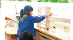
白河市屋内遊び場 「おんぱく」