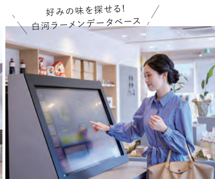
好みの味を探せる! 白河ラーメンデータベース