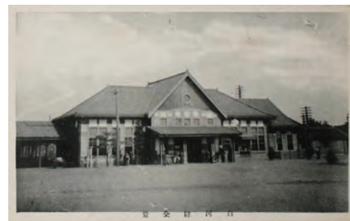
▲大正時代後期～昭和時代初期の白河駅(当時の絵はがきより)

福島県中通りの南部に位置し、栃木県と隣接した白河市。首都圏から新幹線で約70分移動するだけで、歴史や文化、豊かな自然を体感できます。白河では城下町地区に残る歴史や文化資源を守り、活用したまちづくりを進めており、歴史的建造物や伝統行事、伝統技術などが継承され、未来へつなげていくサステナブルな街です。 変わらないものを探しながら、変わったところと見比べてみたり、どのように維持、進化させているのかわを見つめるのも白河旅ならではの。歴史があるからこそ新しいものがより新鮮に映る。そんな街並みに触れてみてはいかがでしょうか。