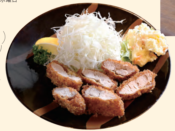
ヒレかつ定食 (小鉢・豆腐・ライス・味噌汁・デザート付)

日本四大そば処の一つである白河で、江戸時代から続く創業200余年の老舗蕎麦店。当時の白河藩主も好んだ蕎麦は、香り高くコシが強いのが特徴です。 TEL:0248-23-2040 [所在地] 福島県白河市本町28 [営] 11:00~19:00 [休] 水曜日