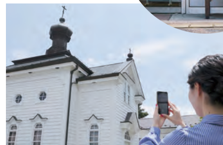
(Shirakawa Orthodox Church of Christ)