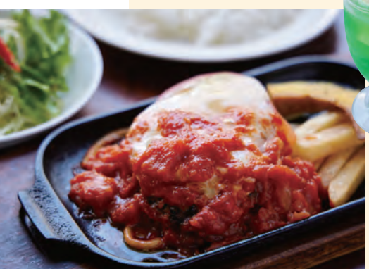
トマトチーズハンバーグ(サラダ・ライス付)とミニメロンフロート

レトロな洋食屋さんメインはハンバーグ! 肉汁があふれるハンバーグは子どもから大人まで大人気。懐かしい喫茶店の様な店内でいただくミニメロンフロートもおススメです。 TEL:0248-23-2015 [所在地] 福島県白河市中町45 [営] 11:30~14:00 / 17:30~20:00 [休] 木曜日