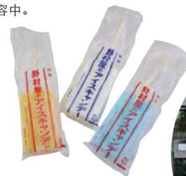
Nostalgic Ice Pops (Nomuraya)