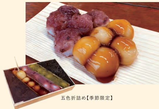
五色折詰め【季節限定】

約100年、変わらない味を継承する名物の団子は、一口サイズの柔らかい食感です。 TEL:0248-23-3679 [所在地] 福島県白河市五郎窪40 [営] 10:00~15:00 [休] 金曜日