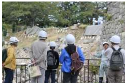
小峰城跡石垣修復箇所一般公開の様子

さらには、東日本大震災により崩落した小峰城跡の石垣修復に対する理解や関心を深めるため、工事の進捗状況や小峰城跡の様子などを定期的に一般公開している。