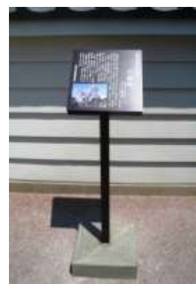
指定文化財説明板

しかし、その一方では収蔵資料の増加に伴い、資料館収蔵庫のスペース不足が大きな課題となっている。また、埋蔵文化財出土品の収蔵施設が各所に点在しているため、一括管理・保存を図ることが困難な状況となっている。今後は、財政状況を勘案し、施設改修計画や新たな収蔵施設の確保に努めていく。