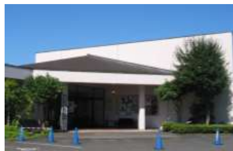
白河市歴史民俗資料館

白河市歴史民俗資料館では、常設展示のほか、収蔵している指定文化財・考古資料・民俗資料・絵画などを中心としたテーマ展及び収蔵品展等