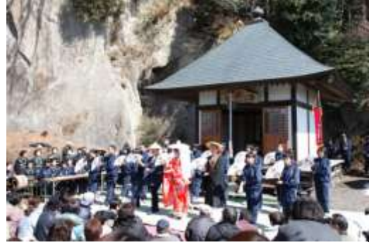
地域の民俗芸能を披露する中学生

介しているほか、すべての指定文化財への誘導・説明板の設置を進めている。また、埋蔵文化財発掘調査の現地説明会を開催しているほか、出前講座事業や各団体の学習会等に積極的に講師派遣を行うなど、文化財に対する知識・理解の高揚に努めている。さらに、文化財保護強調週間及び文化財防火デーに併せた文化財の公開等も実施している。