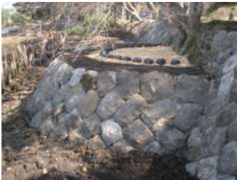
史跡及び名勝南湖公園の護岸整備

今後も、文化財の状況を常に把握した上で、法令に基づき適切な保存を図るとともに、計画的な修理・整備を行う。また、専門的な指導・助言を得ながら、文化財が持つ歴史的価値の保持に努めていく。