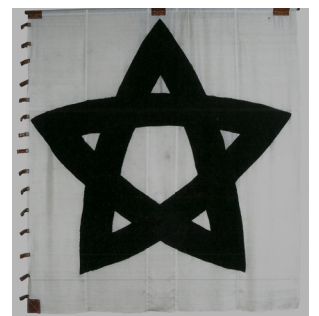
奥羽越列藩同盟旗(複製) (東北歴史博物館蔵)