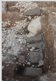
▲発見した石垣 (西から)

この石垣は、表面には粗く加工した面や、自然に割れた面が残り、石材の大きさや形が一定ではない特徴があることから、慶長年間頃(1600年代はじめ頃)に築かれたものと考えられます。小峰城では最も古い時期の石垣で、同じような特徴を持つ石垣は、三重櫓の北面でも確認できます。 慶長年間頃の小峰城は、会津領の支城のひとつでした。この時期の城下を描いたとされる絵図(慶長古図)にも、今回発見した石垣が描かれています。 調査地点周辺の盛土の観察結果