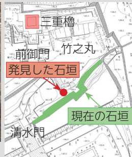
▲石垣を発見した地点

竹之丸南面の石垣修復に伴う発掘調査で、現在の石垣面から7mほど内側の地点から、土の中に埋もれていた石垣を発見しました。