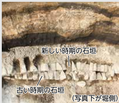
新しい時代の石垣