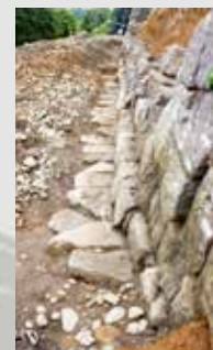
②本丸北面石垣前の石列

今回紹介した地点では、江戸時代の複数回にわたる石垣修復の痕跡が確認されています。 当時の人々は、石垣の崩落や変形に直面しても、その都度改善を試みながら修復を行ってきたことが分かります。 こうして、江戸時代における石垣修復の姿を明らかにすることは、当時の技術や手法をうかがい知ることが出来るばかりではなく、現代の石垣修復にも大いに参考となっています。