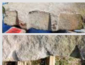
さまざまな形の矢の跡

震災で崩落したり、変形により解体した石垣の、約一万三千個の石材について、形や大きさ・重さ・加工の痕跡などの特徴を記録した「石材カルテ」を作成しました。 石材の中には、石を割る矢(クサビ)の跡が残っているものも確認されました。矢の跡には、長方形や三角形・台形などの形があり、大きさもさまざまで、複数の種類を確認しました。