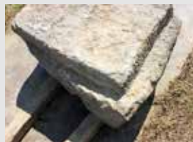
礎石を再利用した石材

石材の表面は、自然な割れ面を残したものの、工具で表面をきれいに整形したもの、粗い加工が施されたものなどの違いがあることも確認できました。 また、江戸時代の石垣修復において、石材を再利用した例も見つかっています。石材の正面を変えたり、礎石(建物の土台)を使用したりするなど、利用できる石材を最大限活用していたことがうかがえます。